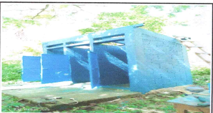
Foto 5: Se observa en la fotografía el trabajo que se esta realizando como la pintada de la pared del baño.