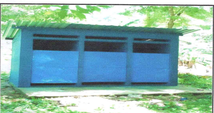
Foto 6: Se observa en la fotografía el cambio del techo del baño y la pintada de la pared interior y exterior.

Observación: Si es necesario se pueden agregar hojas adicionales y actualizar el número de hojas.