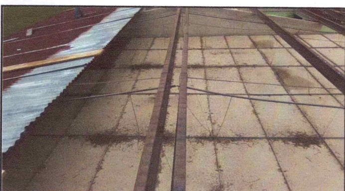
Foto 4: Se observa en la fotografía la quitada de las laminas viejas.