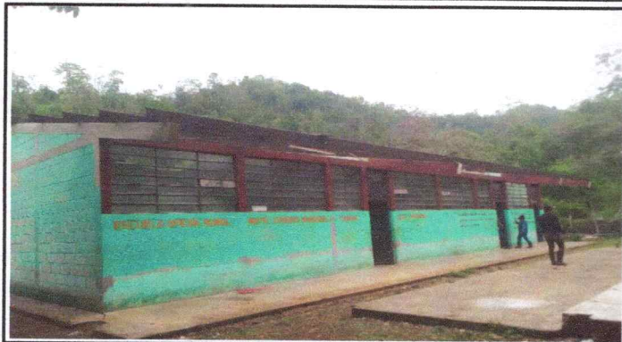
Foto 1: Se observa en la fotografía la lijada de la costanera de la escuela.